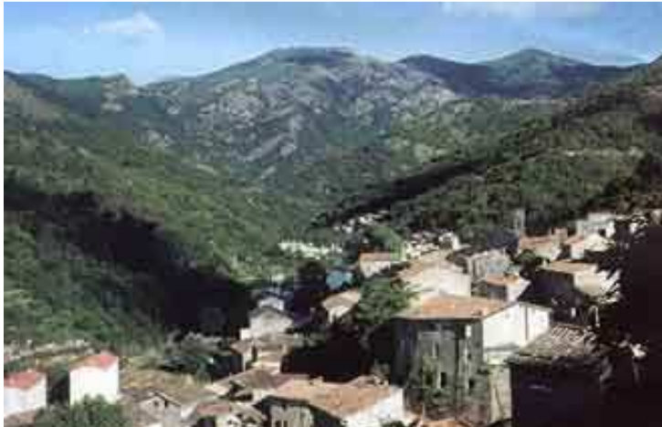
Village de Graissessac

Cette balade vous offrira des paysages de lumière et des panoramas époustouflants en vous amenant à la limite du département.