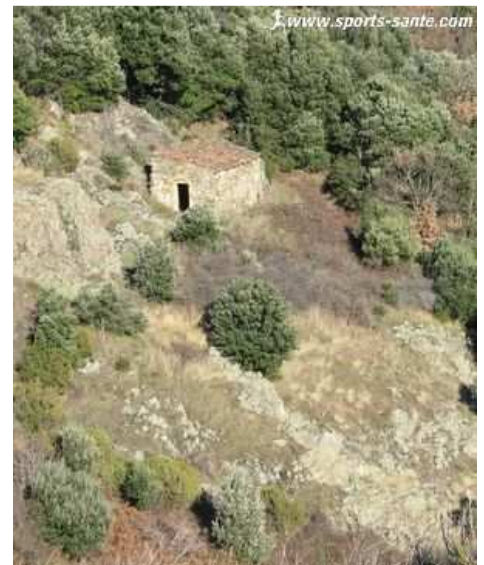
Cabane de berger au col