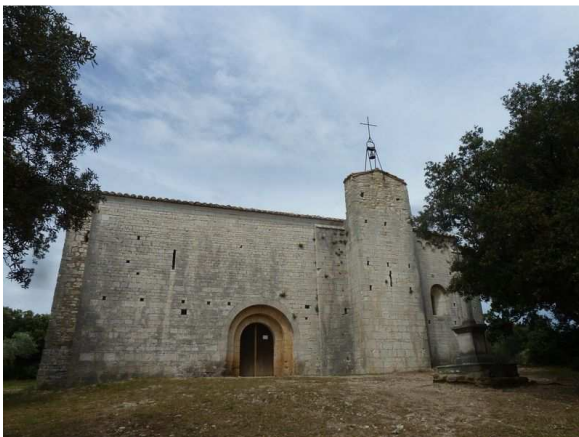
St Sylvestre des Brousses