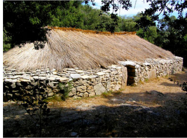
Maison préhistorique Cambous

A 30 km du Crès, une balade au départ du domaine départemental « Les Roussières », commune de Viols-en-Laval (205 habitants). Il est situé dans un espace géographique où l'on trouve de nombreux sites datant de la préhistoire. Le plus connu est celui de « Cambous », considéré comme le plus vieux village de pierre de France (-2800 à -2400 ans), mis à jour en 1967.