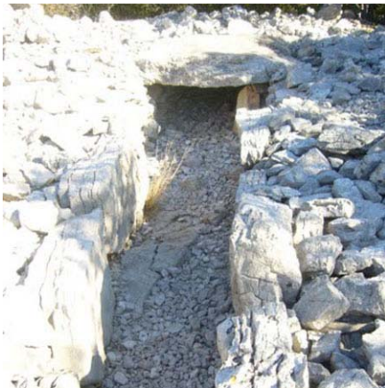
Dolmen La Draille